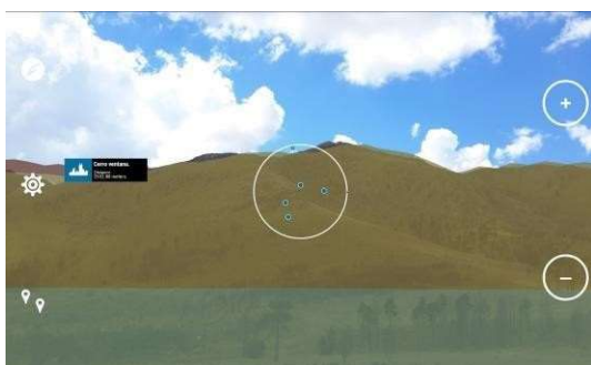
Figura 2: Visualización del terreno 3D y de un punto de interés.

Actualmente se logró unificar la visualización de una superficie 3D, generada a partir de un mapa de altura, con la vista del terreno real (ver Figura 2). Para el subsistema de tracking se utilizaron la tecnología GPS y GLONASS para determinar la posición y una fusión de sensores inerciales y magnéticos para la obtención de la orientación.